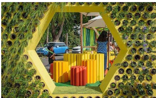
ASLA California Sierra Chapter parklet from PARK(ing) Day 2019.

Es un gran ejemplo ya que muchas veces solo podemos imaginar cómo se verían las aceras o calles con juegos, mesas, sillas o incluso obras de arte, pero con el Parking Day estas ideas de nuestra imaginación se pueden hacer realidad y sobre todo a un bajo costo. Sin duda sería asombroso traer este tipo de proyectos a nuestras comunidades, pues no solo sería una actividad divertida, nos dejaría una buena reflexión sobre el espacio que se está utilizando para actividades que quizá no benefician a los vecinos o visitantes de determinada ubicación.